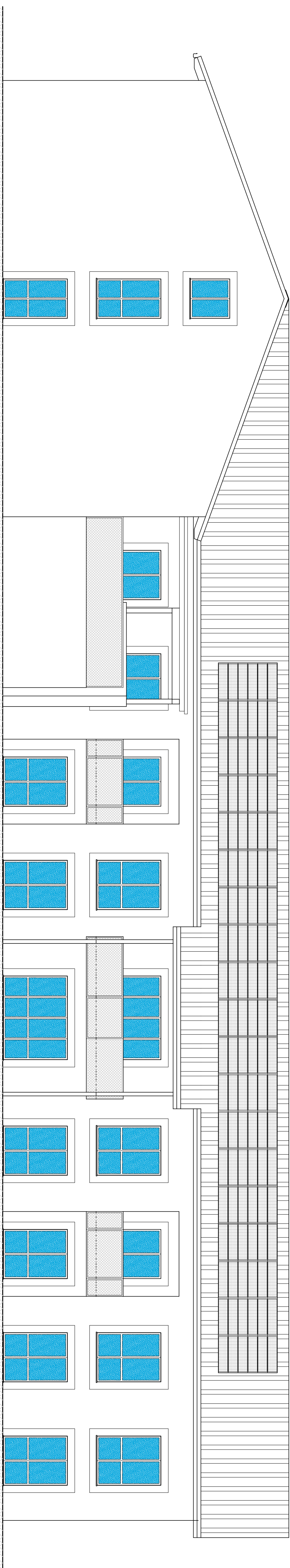
PROSPETTO SUD Scala 1:100

Regione Piemonte Provincia di Novara COMUNE di GRIGNASCO