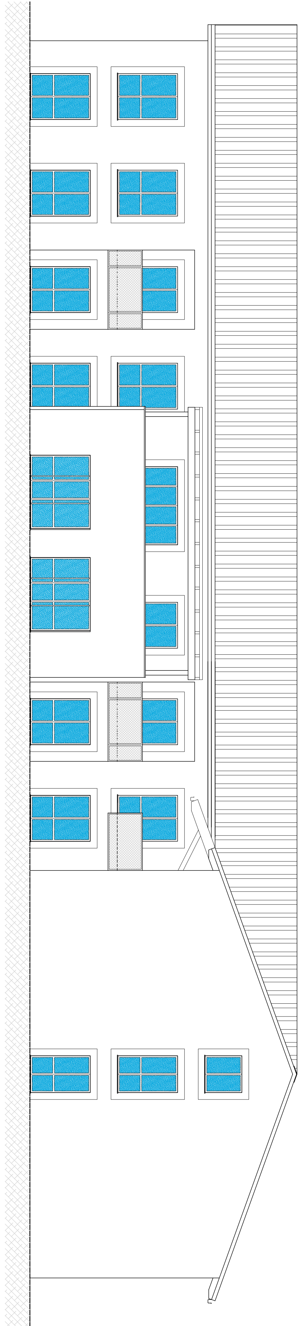
PROSPETTO EST Scala 1:100